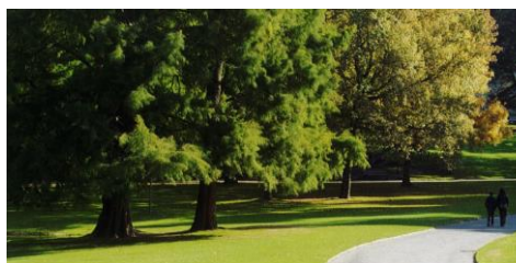
Le parc de Procé Un parc paysager à l'anglaise